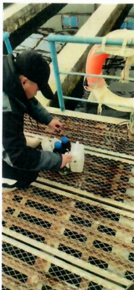
图6-1 污水厂末端排放口处