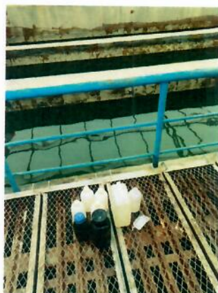
图6-1 污水厂末端排放口处